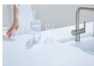
透明感と明るさのある美しさ クリスタルカウンター