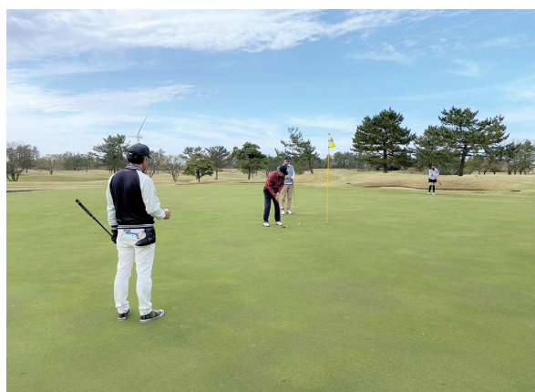
第134回管工事ゴルフクラブ ゴルフコンペ上位入賞者