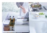
たっぷり入って、サッと取り出せる フロアキャビネット